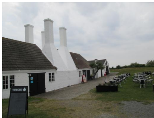
Røgeriet i Hasle.