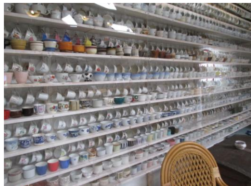
Masser af kopper.