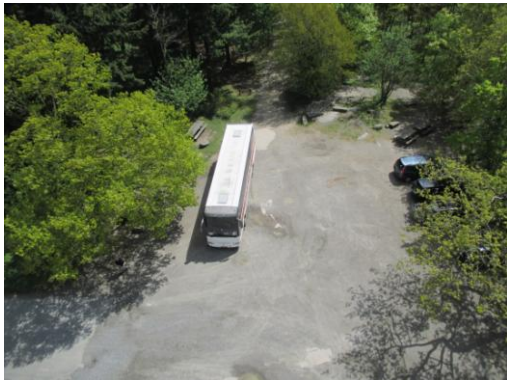
Udsigt fra 172 meter til Adrians bus.

forhøjet med et stålstillads. Med stentårn er Rytterknægten 172 m højt. Tårnet bruges om foråret til ornitologiske observationer.