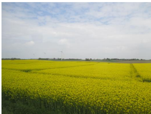
Rapsmarker på Bornholm.