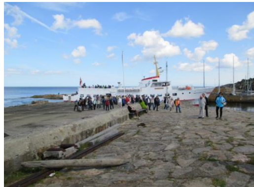
Ankomst fra Christians ø.

Der var udsigt til granitbruddet, hvor man ikke skulle lide af højdeskræk.