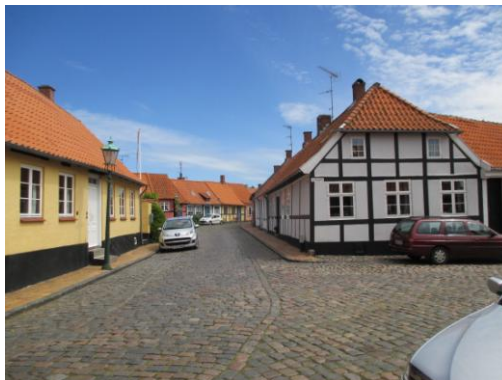
Den gamle bydel i Rønne.

For dem der ønskede det, var der ½ times rundtur til fods i den gamle bydel.