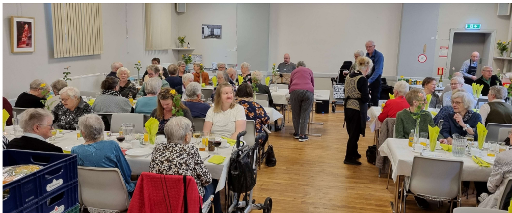
Fra Danmark spiser sammen i Medborgerhuset april 2024