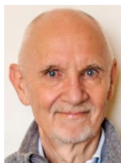
Henning Andersen fotograf