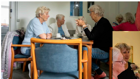
Flytning til Gammel Rustenborg Åbent hus 13. juni