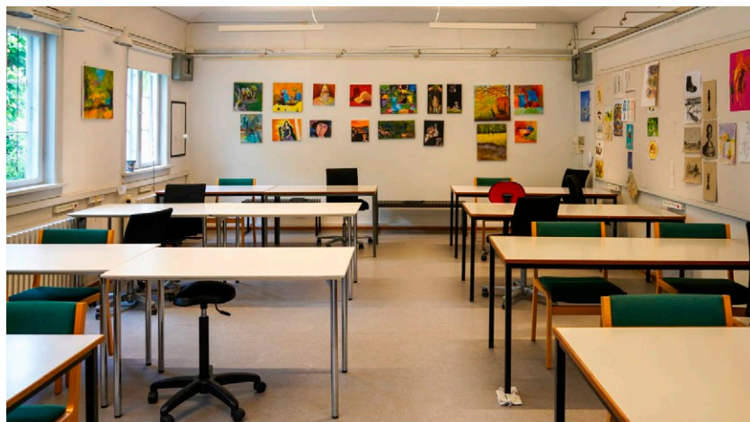
Annekslokalet på Gammel Rustenborg