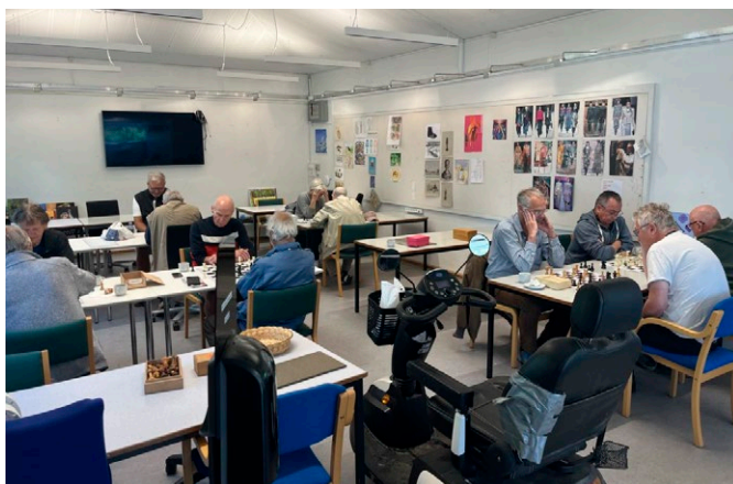
Skak i de nye omgivelser i Annekset på Gammel Rustenborg