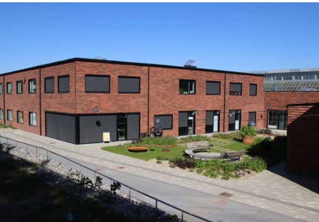
Brohuset Etape 2