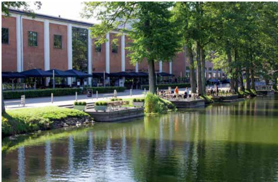
Cafeer ved åen

Ældre Sagens Kontor Medborgerhuset, Bindslevs Plads 5