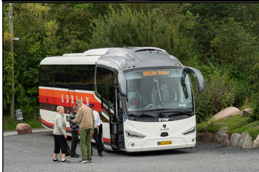
Efter en veloverstået middag, går turen hjem til Ølstykke!