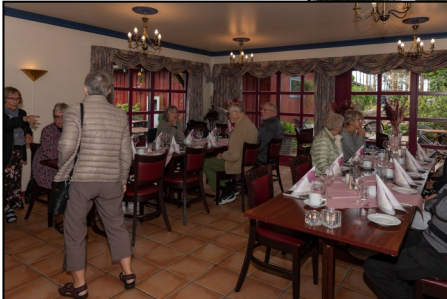
Til højre: Vel ankommet til Gerlev Kro. Herunder: Vi bliver placeret