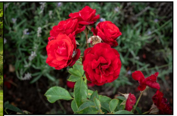
Herover: Mange af roserne var desværre afblomstret, men der var da enkelte tilbage! Til venstre: Hyggelig samtale med en af Rosenhavens venner!