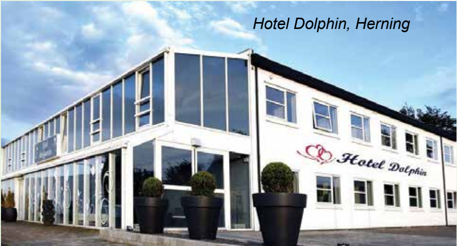
Hotel Dolphin, Herning