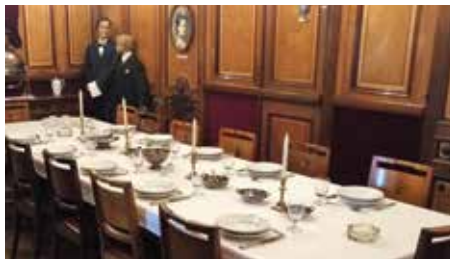
På By og Overfarts Museet så vi hvordan det så ud, når der var dækket fint op i salonen på færgen Sjælland i 1886.