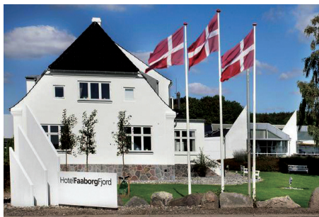
Hotel Faaborg Fjord

Dag 2. Efter et dejligt morgenmåltid byder dagen på ø-hop til