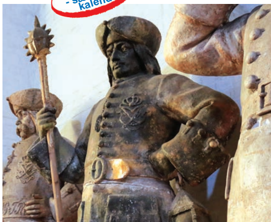
Rådhusloftet rummer mange spændende ting.