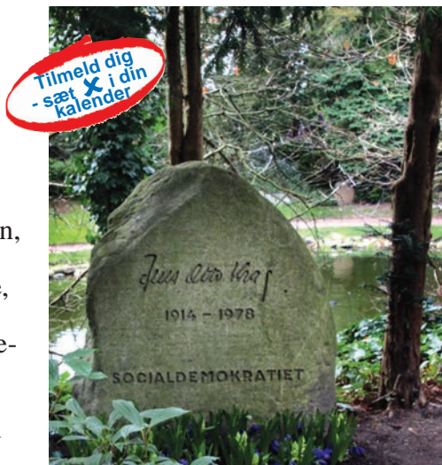
"Det Røde Hav" med de berømte. Her Jens Otto Krag.