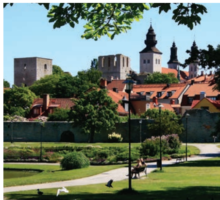
Fantastiske, historiske Gotland.

De gotlandske ”raukare”, kalkstensformationer fra længst for-gangne tider, hæver sig op af havet og er også kendte udenfor landets grænser.