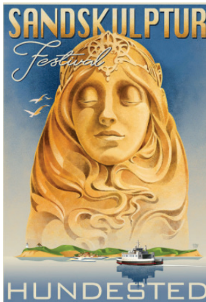
Plakat: Hundested Sandskulptur Festival.