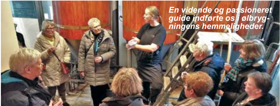
En vidende og passioneret guide indførte os i ølbrygningens hemmeligheder.

flæsketeg) og humlen, hvor bryggeriet benyttede planter fra hele verden afhængig af, hvilken øl der skulle brygges. En vidende og passioneret guide indførte os i mange af ølbrygningens hemmeligheder og gav os en dejlig dag, hvor vi smagte 4 af deres skønne øltyper afsluttende med en lækker frokost.