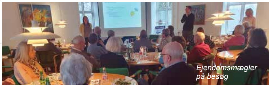
Ejendomsmægler på besøg