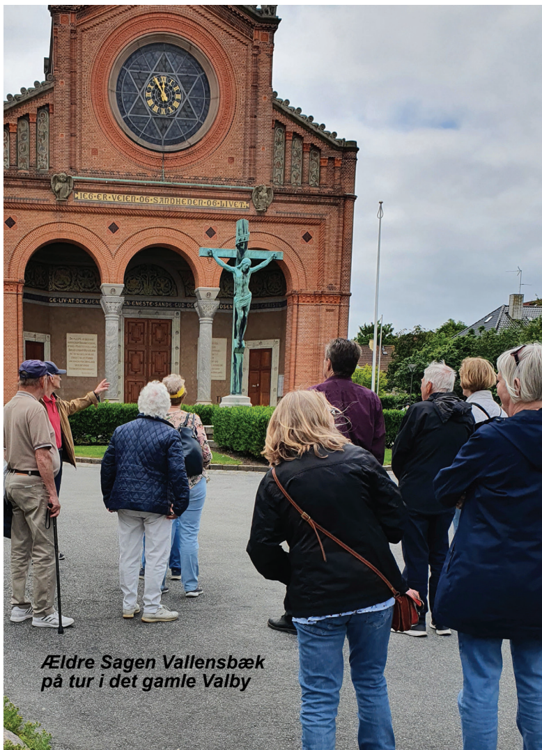
Ældre Sagen Vallensbæk på tur i det gamle Valby