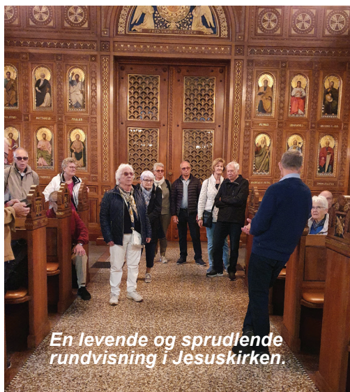
En levende og sprudlende rundvisning i Jesuskirken.

På Tingstedet hørte vi lidt om stedets historie, og alle syntes, der var meget miljø. Vi blev guidet ned ad Mosedalsvej, og undervejs så vi flere gamle hyggelige huse, som ligger tæt rundt omkring Nordisk Film. Vi fik fortalt Nordisk film er den længstlevende filmproducent. Ligeledes fik vi orientering