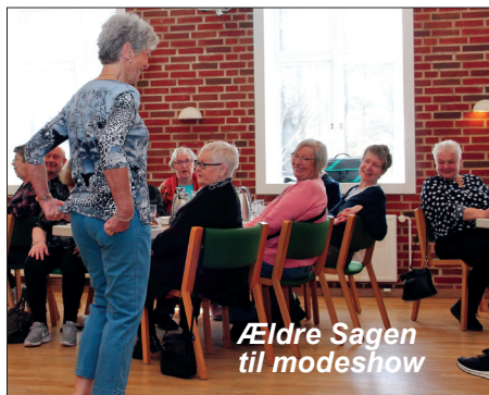
Ældre Sagen til modeshow

Fire senior modeller poserede flere gange rundt i salen med det tøj, som Tøj-Lotte havde valgt kunderne skulle se. Efterfølgende