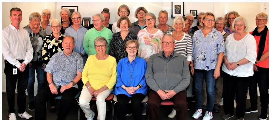
Ældre Sagen i Vallensbæk afholdt slutevaluering for alle læsetanter.