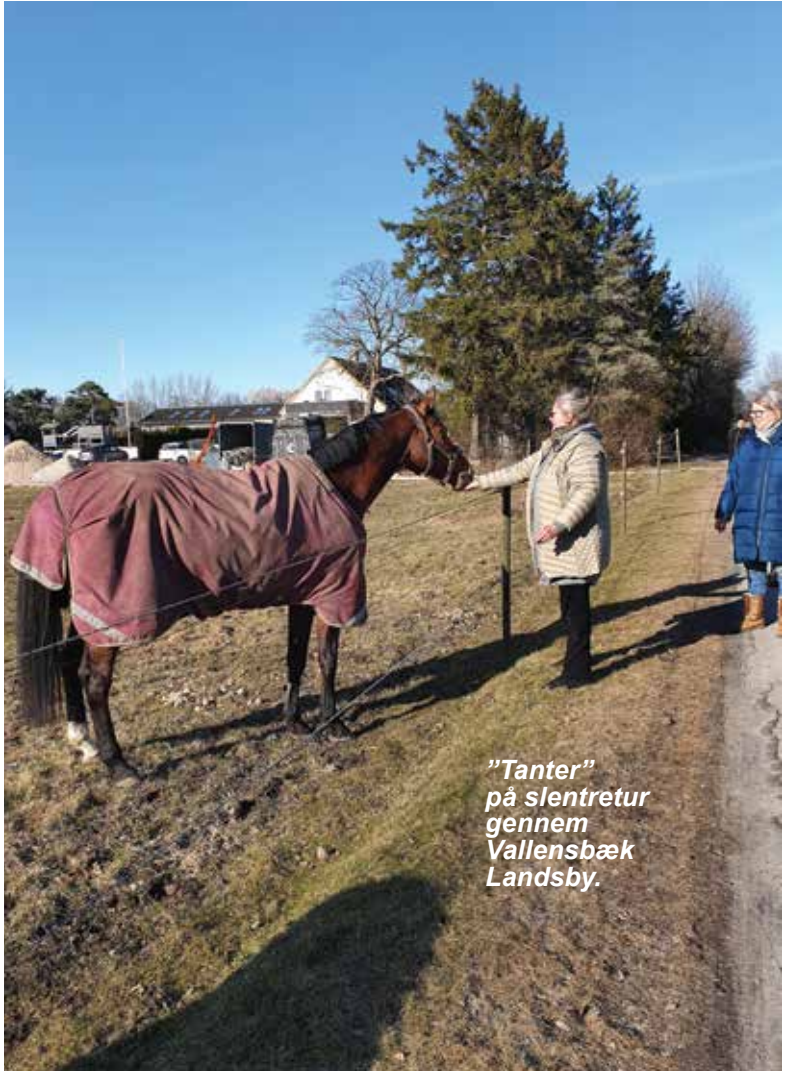
"Tanter" på slentretur gennem Vallensbæk Landsby.