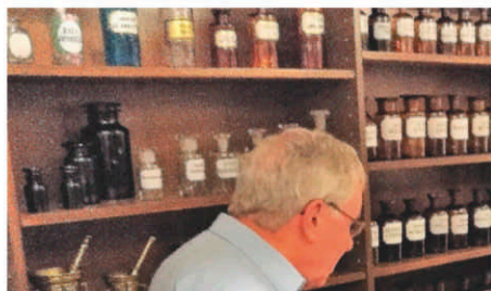
Dansk farmacihistoriske samling i Hillerød.

Kom med på denne tur med efterfølgende frokost på Farmacon (inkl. 1 øl, 1 glas vin, eller en