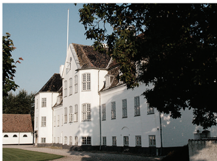
Vi besøger Danmarks største vingård.