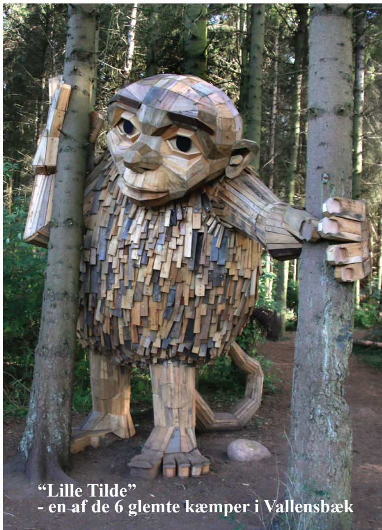
“Lille Tilde” - en af de 6 glemte kæmper i Vallensbæk