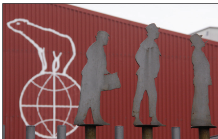
Nordisk Film i Valby.

Vi besøger Nordisk Films gamle scener, der har huset nogle af Danmarks mest populære tv-shows op gennem tiden, og oplever Nordisk Films nye udstilling, der med sikkerhed vil betage og forbløffe fans af de danske filmperler.