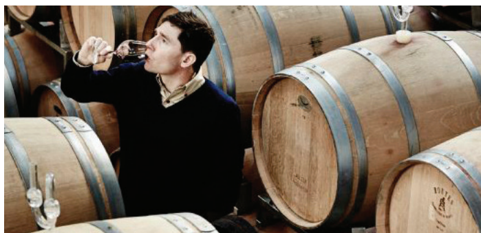
At Frederiksdal Gods på Lolland skulle blive Danmarks største vingård, havde ingen forudset.