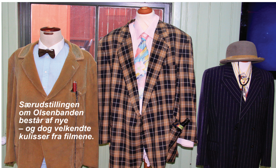
Særudstillingen om Olsenbanden består af nye – og dog velkendte kulisser fra filmene.