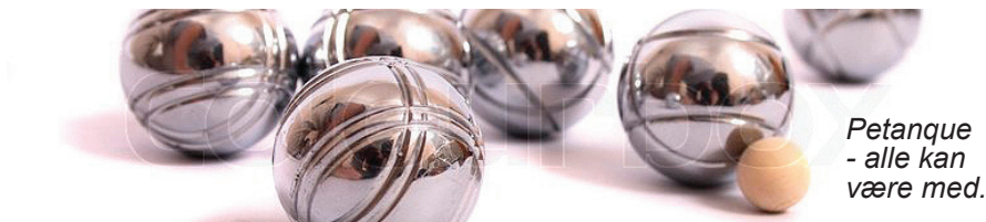
Petanque - alle kan være med.