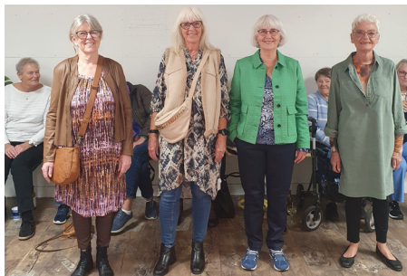
Fire seje catwalk damer.

Charlotte F i Albertslund Centeret havde søndag den 8. september 2023 åbnet dørene for, at Ældre Sagen i Vallensbæk kunne afholde et MODESHOW. 40 gæster havde tilmeldt sig. Den røde løber var rullet ud, og 4 seje catwalk damer nød at fremvise de rober, som Charlotte F havde fundet til dem. Vinterens kollektion 2023/2024 er meget farverig, og alle klappede efter hver catwalk dame havde vendt og drejet sig for