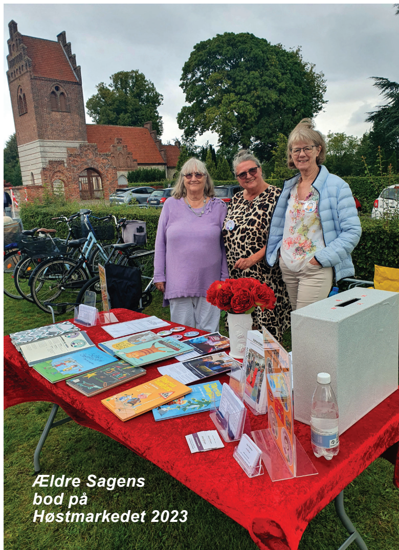
Ældre Sagens bod på Høstmarkedet 2023