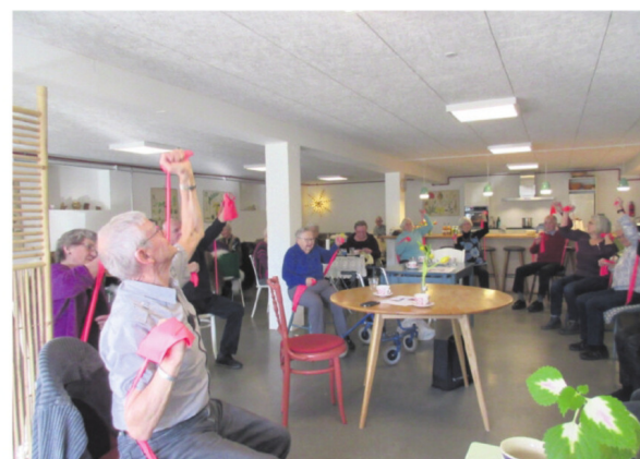
Før der var mad på Bjørnkilde Underværket i Vrads, så var det tid til lidt motion.