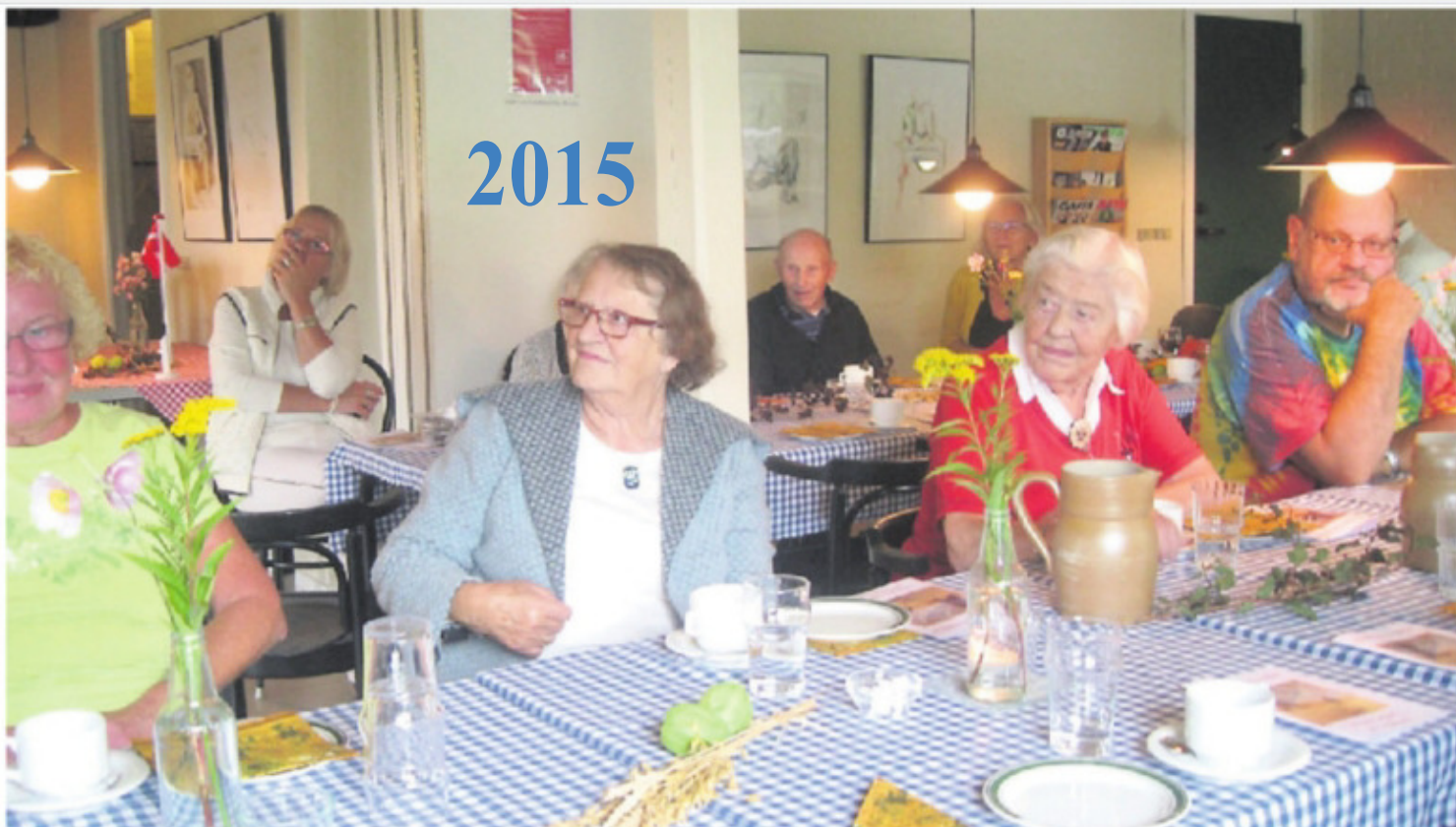
Gæsterne i Hyggecaféen hørte om pigernes bedrift, inden den stod på kaffe og underholdning