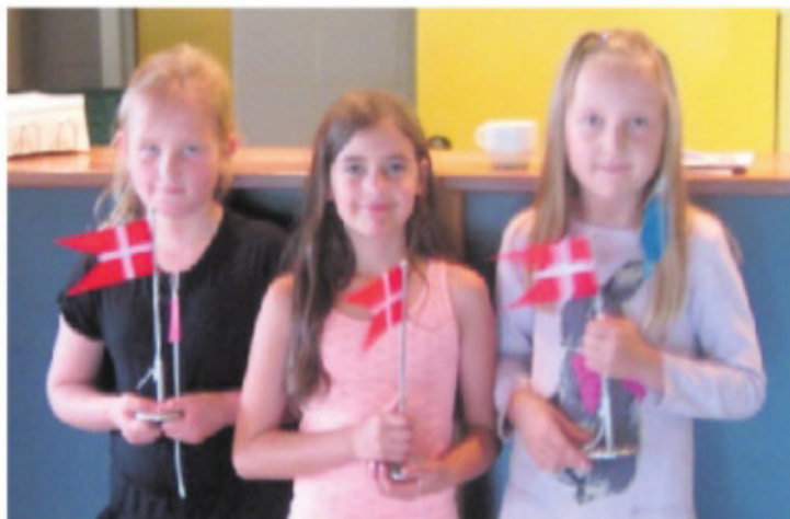
De tre skolepiger fik i Hyggecaféen hver en flot bordflagstang med navn og årstal indgraveret.

Selvom der var en stor eftersøgning i gang, var det de tre ni-årige piger, som fandt kvin-