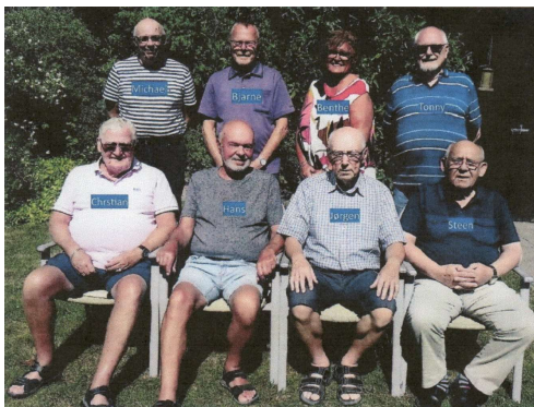
Orkestret Unoderne fra Brønderslev

Tilmelding hjemmesiden eller Ældre Sagens kontor fra 18/3 kl. 10 og senest 8/4 kl. 12.