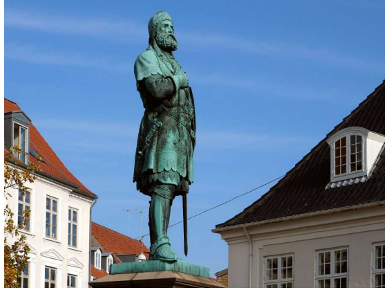
Niels Ebbesens statue i Randers