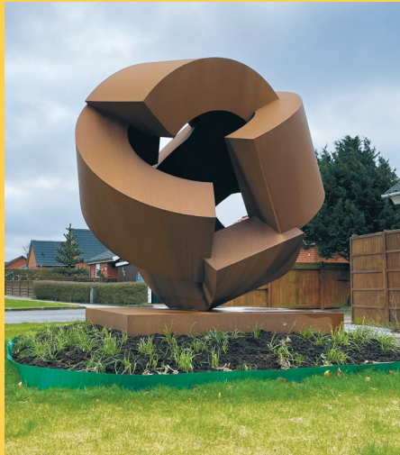
Five Bridges, Alslev