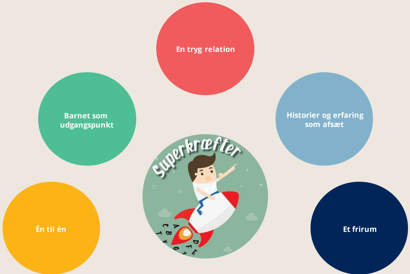
Model over centrale virkemidler i Superkræfter