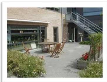
Torstorp Plejehjem og Rehabiliteringscenter

Læsevennerne besøger ovennævnte Plejehjem