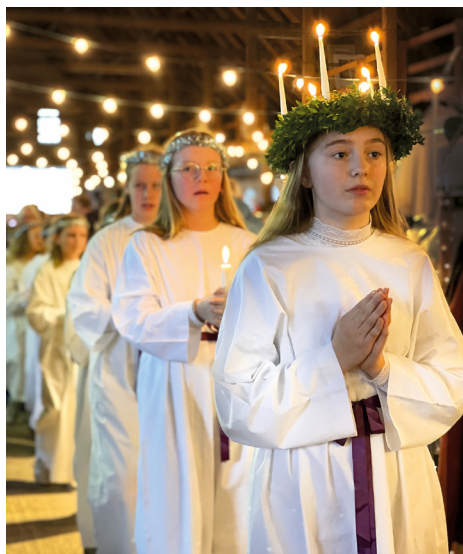
Der foregår mange spændende aktiviteter på julemarkedet, bl.a. Luciaoptoget.

Pris: 590 kr. Turen kan kun tilbydes medlemmer bosat i Høje-Taastrup Kommune.