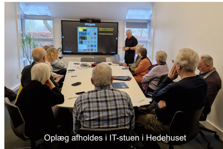
Oplæg afholdes i IT-stuen i Hedehuset

TAASTRUP HOVEDGADE 75 · TLF. 43 99 44 44