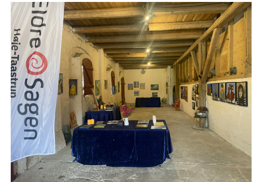
Billedmalernes stand på Livsstilmessen på Ledreborg Slot 2025.

Deltagelse er gratis , da der ingen egentlig undervisning er, og du medbringer selv de materialer, du skal bruge.