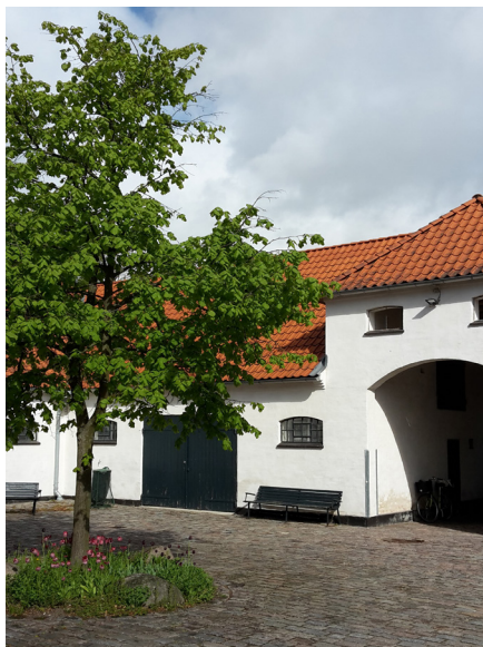
På Blåkildegård på Skolevej i Taastrup er det Lokalhistoriske Arkiv placeret. Desuden er der en udstilling med nogle af L.A. Rings malerier.