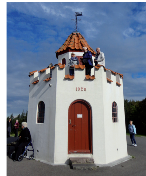
Det 8-kantede udsigtstårn på Ballebjerg er fra 1920 og er 64 m højt - smuk udsigt over Samsø