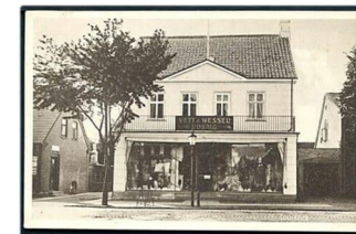
Magasin du Nord i Taastrup, ca. 1910

Pris: 110 kr. inkl. besøg i museet og en let frokost inkl. 1 vand/øl.