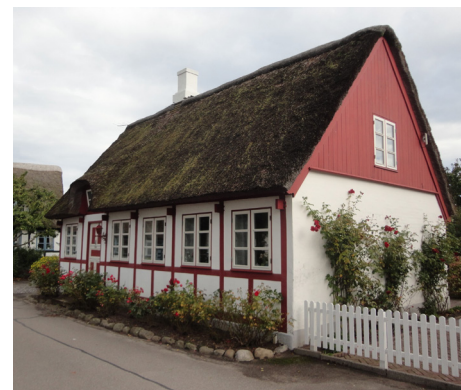
Der findes et stort antal fredede huse på Samsø fra 1700 og 1800-tallet. Dette er et af de gamle idylliske huse ved gadekæret.

Efter en lang og dejlig dag sejler vi tilbage til vores egen ø, Sjælland.