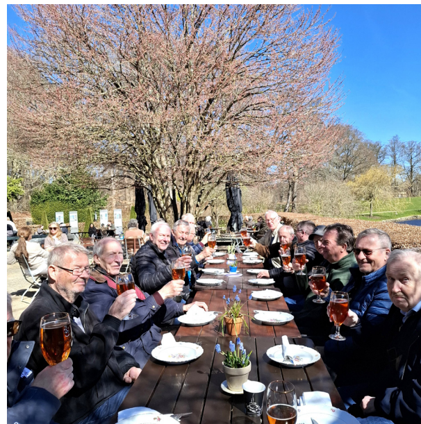
Frokost i Café Havehuset

”Herreværelset” er et tilbud til mænd på 60+. Vi mødes den 2. onsdag i hver måned. Møderne er uforpligtende og tilrettelægges af deltagerne selv. Vi veksler mellem foredrag og udflugter. I maj måned var det 10 år siden, at vi startede Herreværelset.