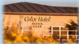
Color Hotel Skagen Gl. Landevej 39 9990 Skagen

Efter morgenmaden kører vi en tur til Grenen. Her kan man enten gå ud til Grenen eller benytte sig af Sandormen (ca. 40,- t/r) Sidst på formiddagen sætter bussen Jer af i det centrale Skagen, hvor der er tid på egen hånd, indtil midt på eftermiddagen, hvor vi påbegynder hjemturen.