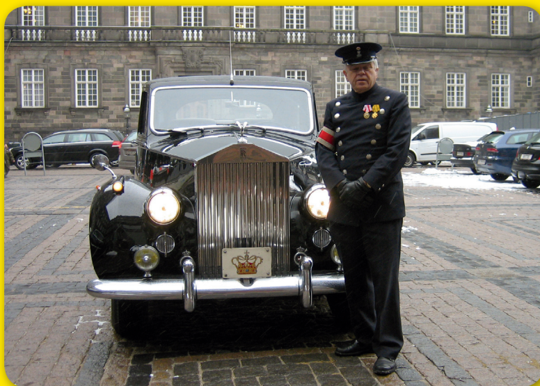
STORE KRONE - se side 6

Velkommen til efterårssæsonen med aktiviteter, foredrag, arrangementer, udflugter og rejser