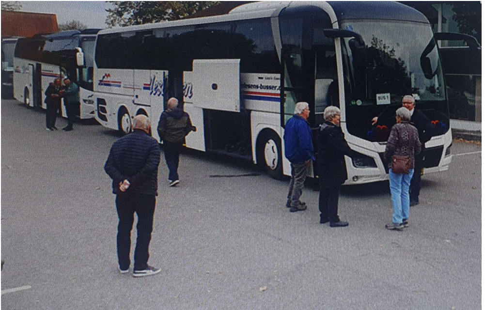
Der har i en årrække været tradition for tre busser til Ældre Sagens løvfaldstur