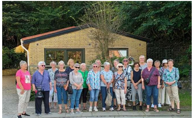
Ældre Walk i Ældre Sagen Hobro