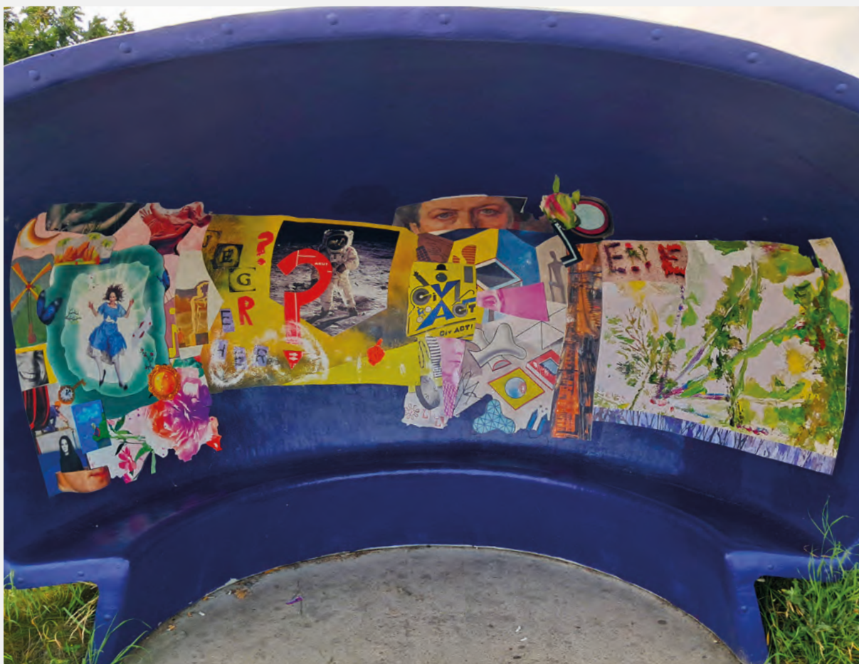
Pia Knudsens kollager er en del af Århus Kommunes projekt Bedre Byrum, hvor kollagerne blev udstillet i en "Busbobbel"