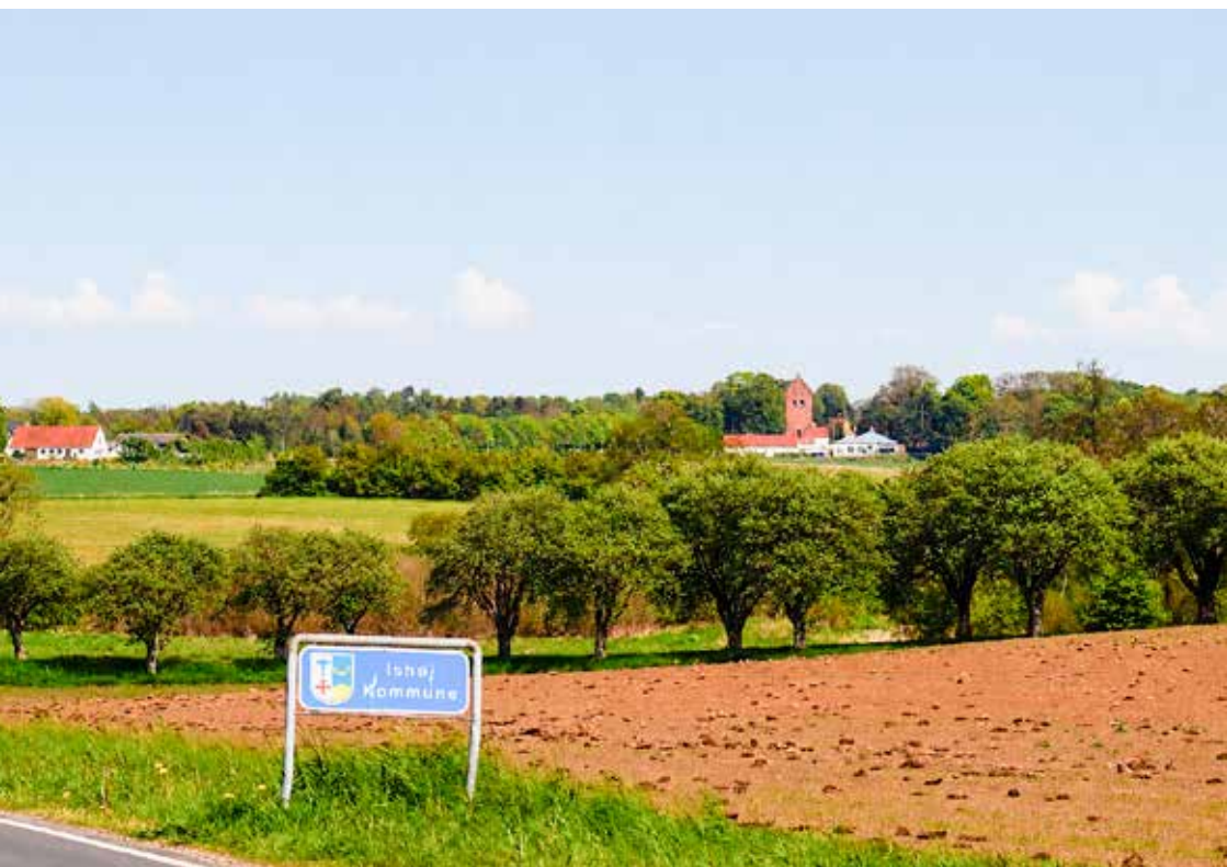
Udsigt over Torslunde