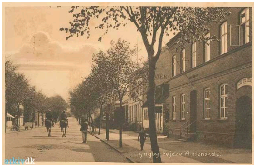
Lyngby Højere Almenskole. Postkort ca. 1915

Skolen på Hovedgaden tog herefter navneforandring til "Lyngby Underskole", og I 1959 blev skolen en selvejende institution under navnet "Lyngby Private Skole". Og det hedder skolen den dag i dag!