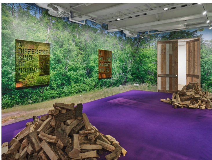
Rirkrit Tiravanija, A MILLION RABBIT HOLES , 2024. Installation view, Pilar Corrias, London, 2024.

Præsentationen er den første i en ny serie, der de næste år bliver en fast del af kunsthallens program. Udstillingerne vises i et separat rum i stueetagen og viser altid ét større, totalomsluttende værk.