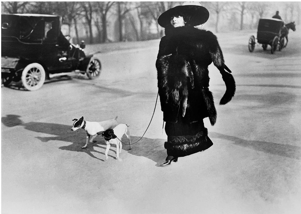
Jacques-Henri Lartigue, Avenue du Bois de Boulogne Paris , 1911. Fra udstillingen Lartigue, Gammel Strand, 1989