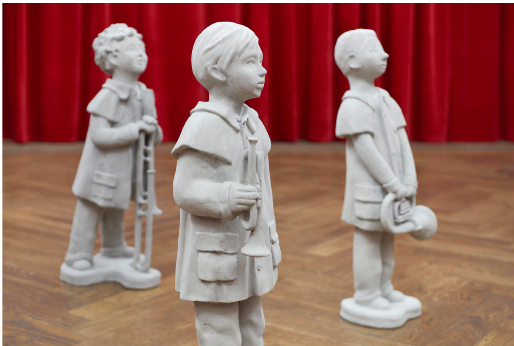
Diego Marcon, La Banda di Crugnola (Have you checked the children) , 2023.