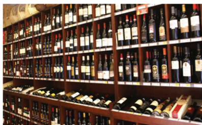
Din vin og tobakshandler

Åbent hver dag fra 8.00 Man-fredag til: 18.00 Lørdag til 14.00