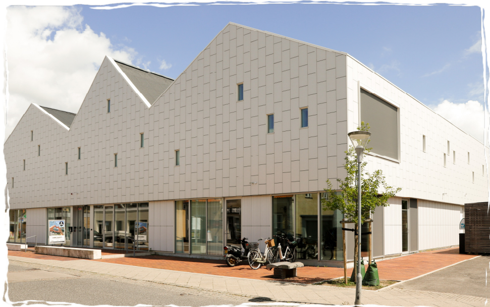
Cosmos, Viby Sjælland