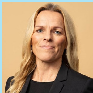
Ældreminister Mette Kierkgaard

Sted: Teatersalen i Farum Kulturhus. Vores Ældreminister, Mette Kierkgaard, kommer til Farum og holder foredrag over emnet: Ældre-reformen. Hun har netop haft hovedansvaret for reformens