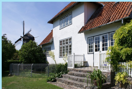
Johannes Larsen Museet, Kerteminde